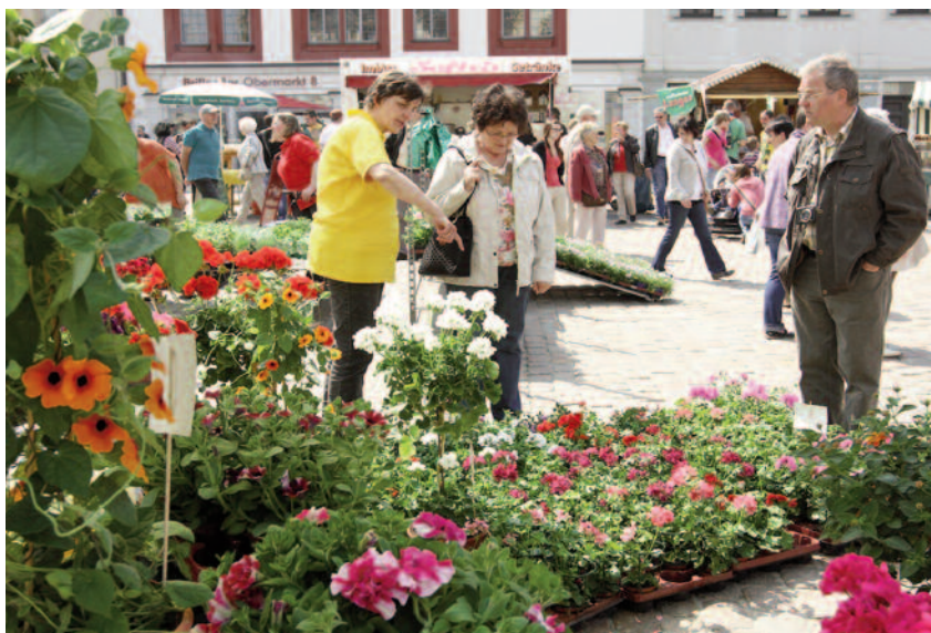
Der Blumen- und Pflanzenmarkt auf dem Obermarkt hat am Freitag von 8 bis 17 Uhr geöffnet, Samstag von 8 bis 14 Uhr und Sonntag von 13 bis 18 Uhr.

Blumen- und Pflanzenmarkt vom 16. bis 18. Mai auf den Obermarkt: 14 Gärtner und Händler aus ganz Sachsen werden dort Garten- und Balkonpflanzen, Schnittblumen, Topfpflanzen, Gemüsesetzlinge, Kräuterpflanzen, Blumenzwiebeln, Saatgut und alles was grünt und blüht anbieten, informiert das Amt für Kultur-Stadt-Marketing. Eine gute Gelegenheit für alle, sich Frühlings-Blumenschmuck für den Garten oder auch den Balkon zusammenzustellen. Die Gartenfachleute mit dem grünen Daumen beraten gern und bieten dazu sächsische Qualitätsprodukte an. Abgerundet wird das Angebot mit passenden Pflanztöpfen und geflochtenen Gartendekorationen sowie Besonderheiten wie Ziegenkäse, -joghurt und -eis, Leinöl und -klitscher.