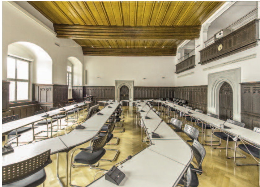
Tag der neue Stadtrat hier schon im September?

Mit Schreiben vom 15. Juli dieses Jahres teilte das Landratsamt mit, dass die Feststellung des Wahlergebnisses vom 6. Juni 2014 wegen Unrichtigkeiten aufgehoben wird, und forderte die Stadt Freiberg auf,