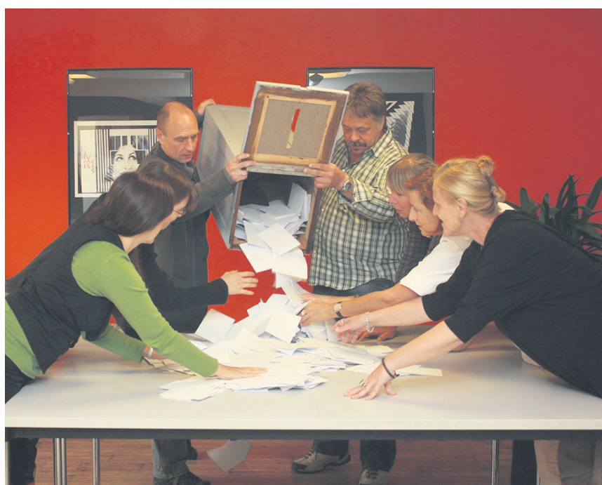
Spannend wird es, wenn die Wahllokale schließen und die Auszählung beginnt - wie hier zur OB-Wahl vor sieben Jahren.

Kommt es jedoch zu einem zweiten Wahlgang, so ist mit dem endgültigen Wahlergebnis Ende Juli zu rechnen. Die Bekanntmachung des Wahlergebnisses erscheint am 26. Juni 2015 im Amtsblatt der Stadt Freiberg. Auch hier hat das Landratsamt einen Monat Zeit, das Wahlergebnis zu überprüfen.