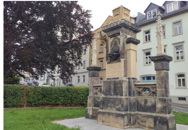
Die Fialen, spitze Türmchen, sind montiert (Stand: Juli 2022)

Spendenaufwurf für den Wiederaufbau des Denkmals vom Hornbrunnen