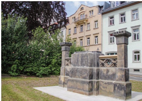
Wächst beständig und sichtbar ... (Stand: Juni 2018)