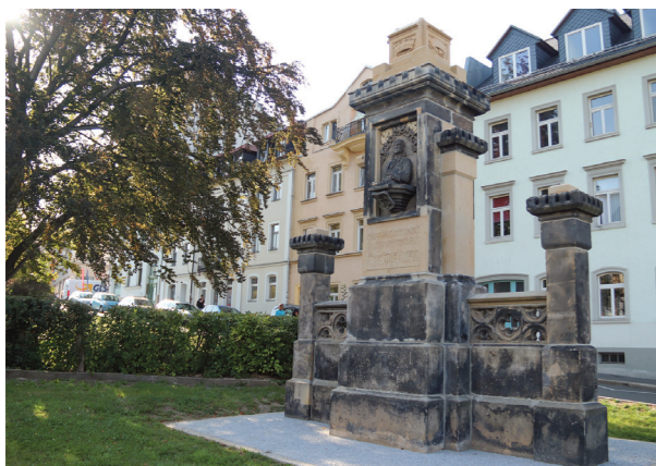
Noch fehlen vor allem die filigranen Teile. (Stand: September 2020)