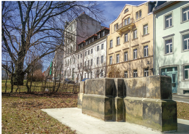
Schon Anfang 2018 steht der Sockel ... (Stand: März 2018)