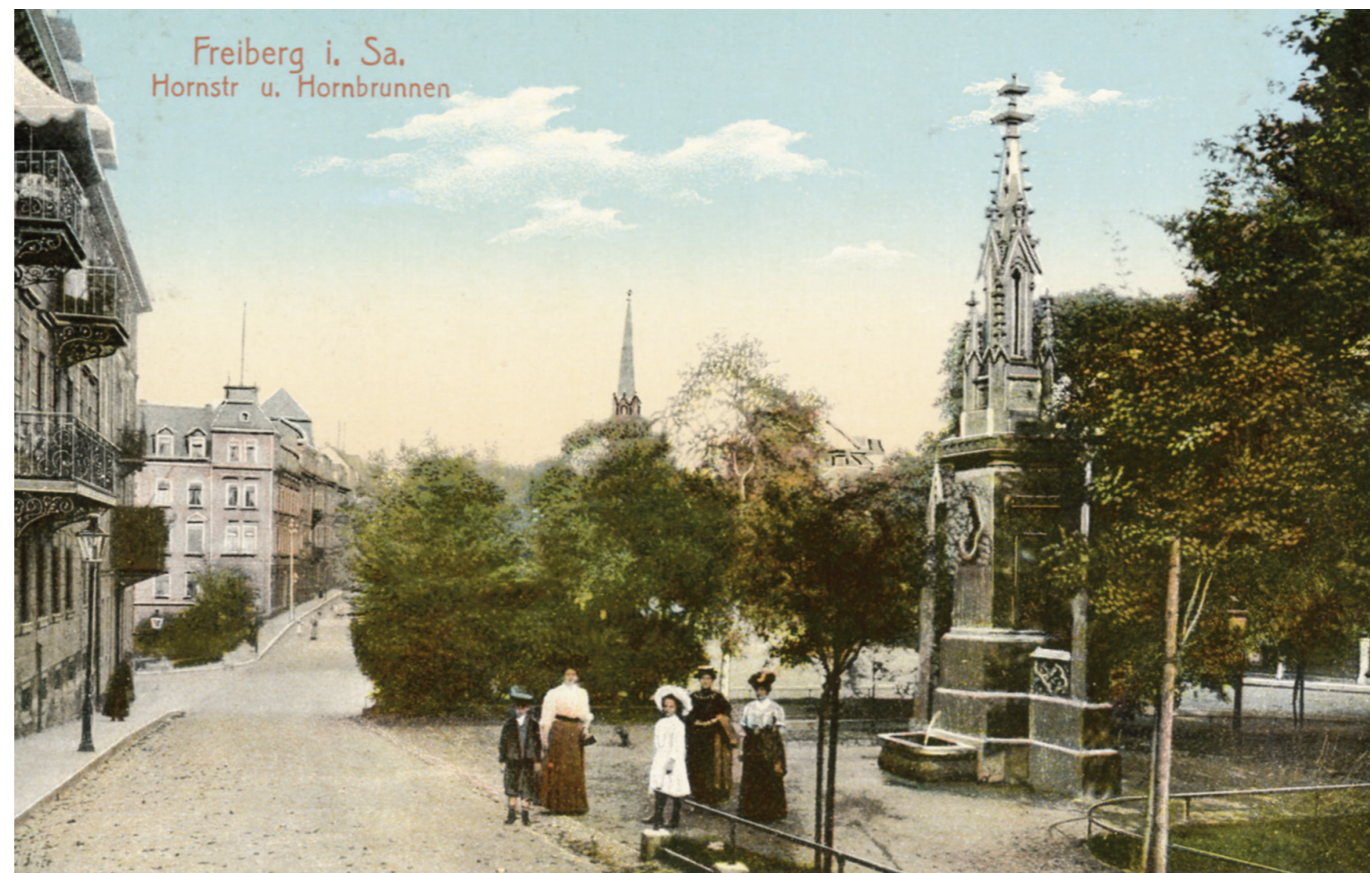
Historische Postkarte. Ohne den hier abgebildeten Brunnenanbau soll das Denkmal wieder entstehen.

Im Jahr 2002 waren für die Sanierung und den Wiederaufbau des Hornbrunnens Gesamtkosten von 265.000 Euro ermittelt worden. 40.000 Euro sollten, so hatte es die Mehrheit des Stadtrates damals beschlossen, durch Spenden aufgebracht werden. Das ist seinerzeit leider nicht gelungen. Lediglich etwas mehr als 2.000 Euro wurden gespendet. Diese Mittel sind in den Grundstock für den jetzigen Wiederaufbau eingegangen.