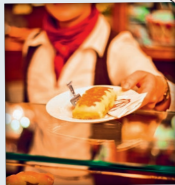
Original Freiburger Eierschecke