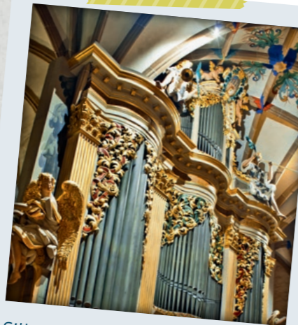
Silbermann-Orgel im Dom

Kinderführungen im Dom: immer mittwochs 15 Uhr in den sächsischen Ferien, Anmeldung unter: 03731 22598 und verkauf@freiberg-dom.de , www.freiberger-dom.de , Familienkarte 11 € (ohne Orgel).