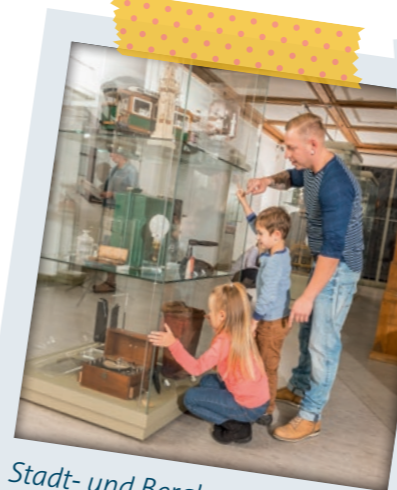
Stadt- und Bergbaumuseum

STADT- UND BERGBAUMUSEUM Komm mit auf eine Reise durch die 850-jährige Geschichte unserer Stadt. Entdecke viele Geschichten von Bergleuten, Silberschätzen und Meisterwerken. Kleine Berggeister aus Holz begleiten dich dabei. Öffnungszeiten: Di – So: 10 – 17 Uhr, Kinder bis 16 Jahre und Schüler haben freien Eintritt, Am Dom 1, 09599 Freiberg, Tel.: 03731 202512, www.museum-freiberg.de