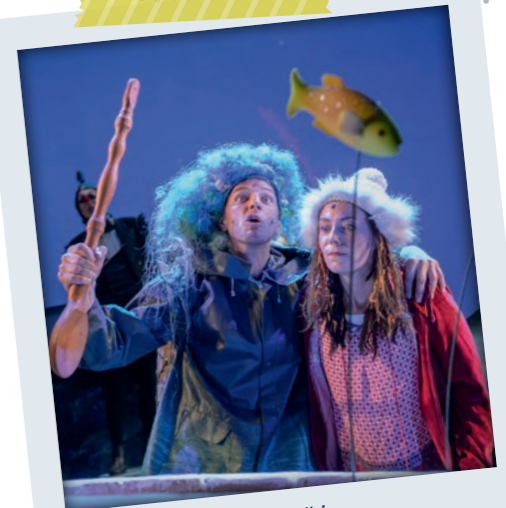
„Die Schneekönigin“ im Mittelsächsischen Theater

Öffnungszeiten: Di–So: 11–17 Uhr und nach Vereinbarung, Kinder unter 18 Jahren haben freien Eintritt, Schloßplatz 6, 09599 Freiberg, Tel.: 03731 7746505, www.silbermann.org