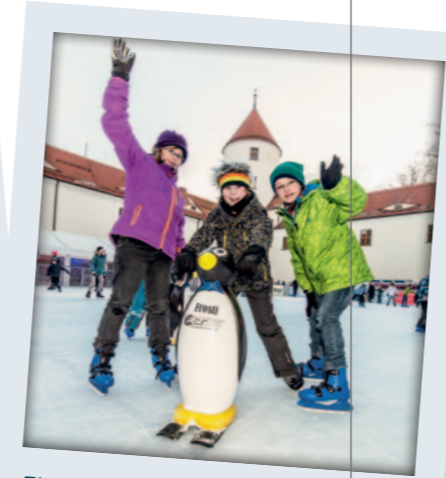
Eisbahn im Schloss