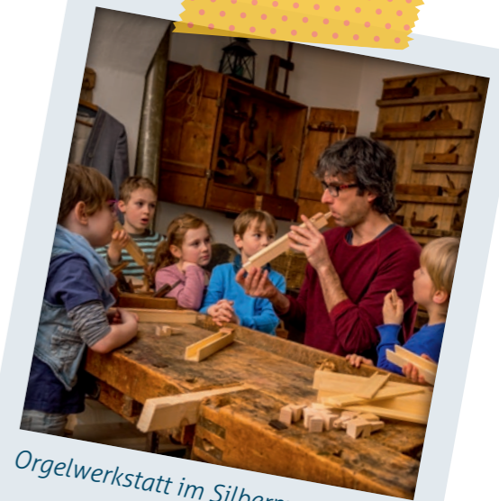
Orgelwerkstatt im Silbermann-Haus