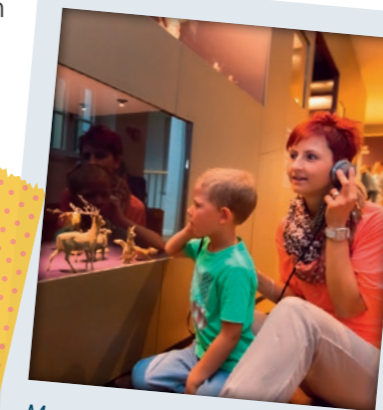
Manufaktur der Träume