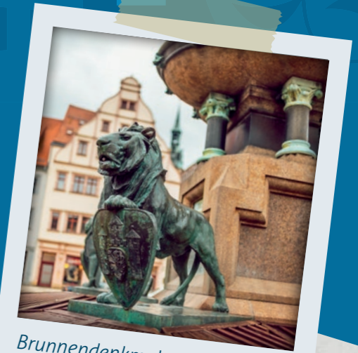
Brunnendenkmal mit 4 wasserspeienden Löwen

Das Stadtwappen zeigt einen schwarzen Löwen auf goldenem Schild vor der Stadtmauer mit Türmen und Tor und Fähnchen auf den Turmspitzen. Schwarz und Gelb sind Freibergs Stadtfarben.