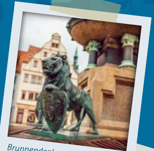
Brunnendenkmal mit 4 wasserspeienden Löwen

Das Stadtwappen zeigt einen schwarzen Löwen auf goldenem Schild vor der Stadtmauer mit Türmen und Tor und Fähnchen auf den Turmspitzen. Schwarz und Gelb sind Freibergs Stadtfarben.