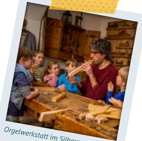
Orgelwerkstatt im Silbermann-Haus