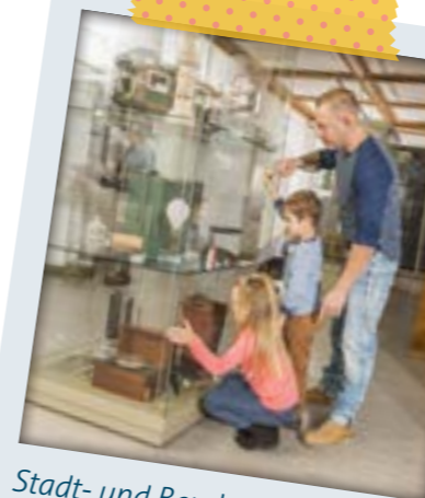
Stadt- und Bergbaumuseum

Öffnungszeiten: Di – So: 10 – 17 Uhr, Kinder bis 16 Jahre und Schüler haben freien Eintritt, Am Dom 1, 09599 Freiberg, Tel.: 03731 202512, www.museum-freiberg.de