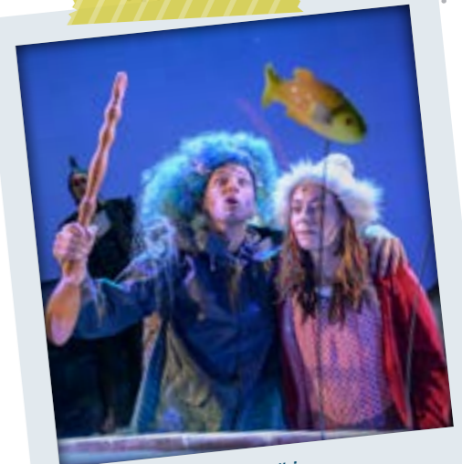
„Die Schneekönigin“ im Mittelsächsischen Theater

Öffnungszeiten: Di–So: 11–17 Uhr und nach Vereinbarung, Kinder unter 18 Jahren haben freien Eintritt, Schloßplatz 6, 09599 Freiberg, Tel.: 03731 7746505, www.silbermann.org