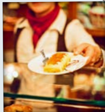
Original Freiberger Eierschecke