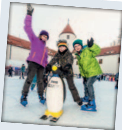
Eisbahn im Schloss