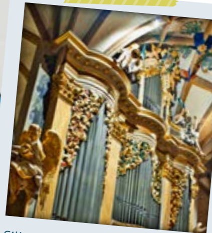
Silbermann-Orgel im Dom

Kinderführungen im Dom: immer mittwochs 15 Uhr in den sächsischen Ferien, Anmeldung unter: 03731 22598 und verkauf@freiberg-dom.de , www.freiberger-dom.de , Familienkarte 11 € (ohne Orgel).