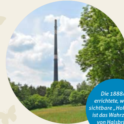
Die 1888/89 errichtete, weithin sichtbare „Hohe Esse“ ist das Wahrzeichen von Halsbrücke.