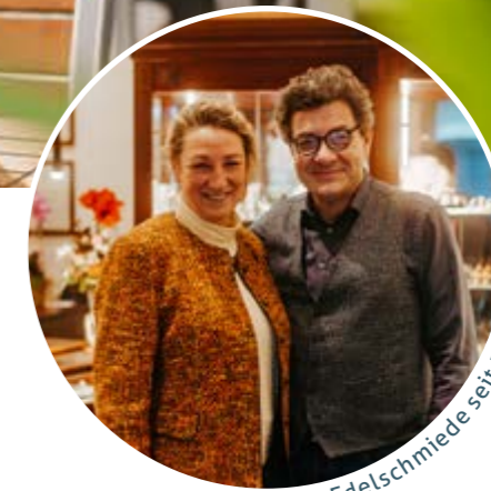
Gold- und Edelschmiede seit 50 Jahren