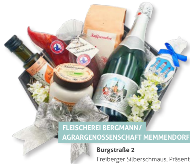
FLEISCHEREI BERGMANN / AGRARGENOSSENSCHAFT MEMMENDORF

Schweizer Qualitäts-Kugelschreiber von Caran d'Ache, lebenslange Garantie