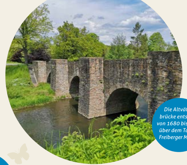
Die Altväterbrücke entstand von 1680 bis 1715 über dem Tal der Freiburger Mulde.