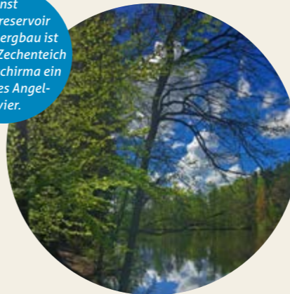
Einst Wasserreservoir für den Bergbau ist heute der Zechenteich bei Großschirma ein beliebtes Angelrevier.