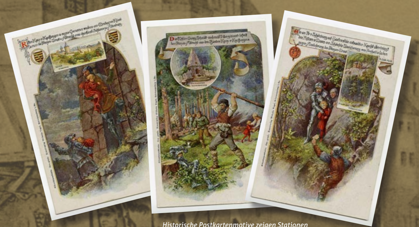
Historische Postkartenmotive zeigen Stationen des Altenburger Prinzenraubes

Nach gründlicher Planung machte sich ein Trupp von 30 Reitern in der Nacht zum 8. Juli 1455 zur Burg des Kurfürsten, dem heutigen Schloss Altenburg, auf. Komplizen öffneten die Tore, sodass der erste Teil des Plans gelang. Mit den beiden Prinzen im Schlepptau verschwand Kunz samt seinen Männern in der Dunkelheit. Doch kaum hatten sie das Burgtor