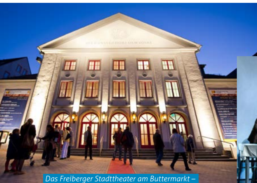
Das Freiburger Stadttheater am Buttermarkt – 1790 wurde das 1623 errichtete Gebäude zum Theater umgebaut

Bereits 1994 war das Freiburger Stadttheater im Zuge einer Neukonzeption der sächsischen Kulturpolitik zum Mittelsächsischen Theater geworden: Informationen über den aktuellen Spielplan mit Musiktheater, Schauspiel und Konzerten unter www.mittelsaechsisches-theater.de und beim Publikumservice im Silbermann-Haus am Schloßplatz.