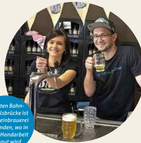
Im alten Bahnhof Halsbrücke ist eine Kleinbrauerei entstanden, wo in echter Handarbeit gebraut wird.