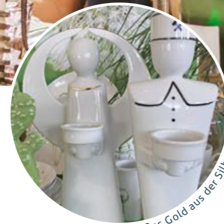
Weißes Gold aus der Silberstadt®