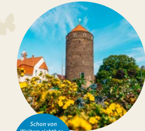
Schon von Weitem sichtbar... der Donatsturm. Idealer Ausgangspunkt für viele Touren.

Ein echter Klassiker ist die Freiburger Ortsumradlung. Diese abwechslungsreiche Rundtour auf historischen Pfaden führt von der Silberstadt® in das Bergbaurevier Halsbrücke, durch das malerische Muldental, nach Kleinwaltersdorf und Kleinschirma, bis in das Bergbaurevier Zug.