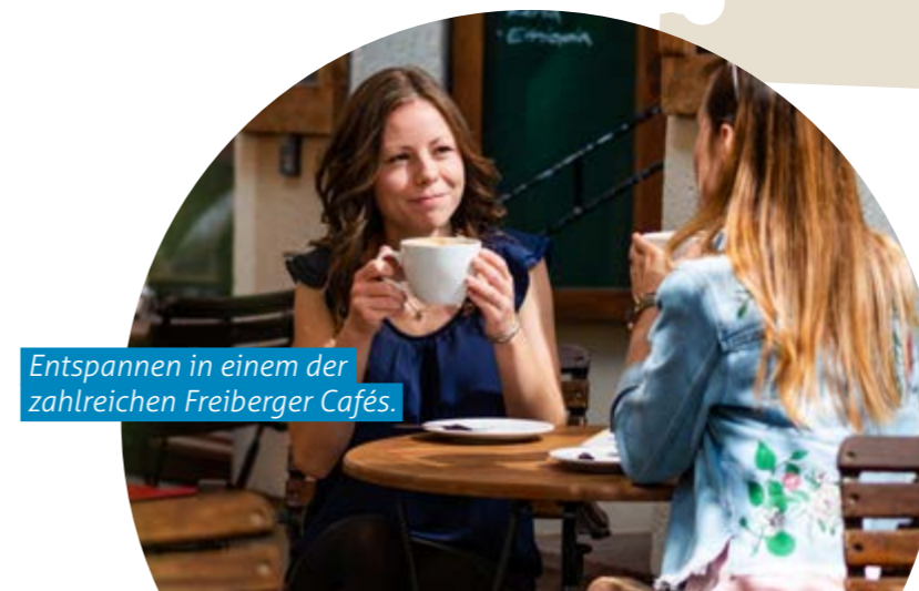
Entspannen in einem der zahlreichen Freiberger Cafés.

„Die Freiberger Eierschecke ist weder vom Geschmack, noch vom Aussehen ähnlich zur Dresdner Eierschecke. So ist sie nur wenige Millimeter hoch und wird komplett ohne die sonst übliche Quarkschicht im Inneren hergestellt. Auch ist die Konsistenz der Freiberger Scheckenmasse eine ganz andere, da hier sprichwörtlich nur das Gelbe vom Ei zur Anwendung kommt. Ist die Scheckenmasse hergestellt und auf einem feinen Hefeteigboden verteilt, wird sie in unserer Backstube noch mit Rosinen und Mandelblättchen veredelt. Das macht unsere Freiberger Eierschecke zu einer regionalen Spezialität der Extraklasse.“* „Das ist sagenhaft!“, so das Urteil des MDR-Reporters S. Marx im Beitrag „Die Freiberger Eierschecke – Unser Reporter bäckt beim Profi“.