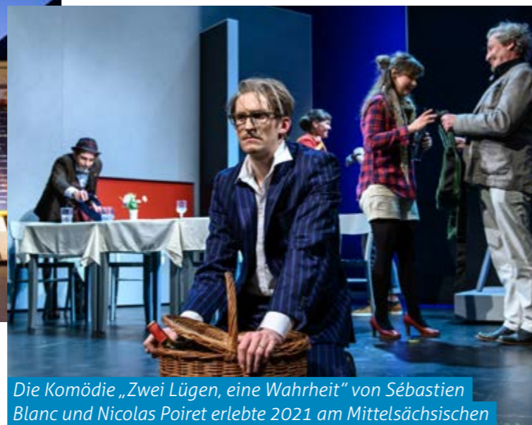
Die Komödie „Zwei Lügen, eine Wahrheit“ von Sébastien Blanc und Nicolas Poiret erlebte 2021 am Mittelsächsischen Theater ihre deutschsprachige Erstaufführung.