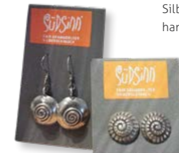
FAIRKAUF LADENCAFE FREIBERG

Original erzgebirgscher Bergwichtel mit Silbererz, limitierte Auflage