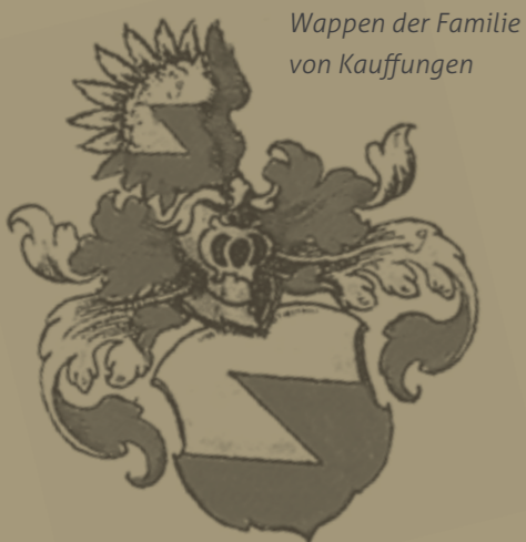
Wappen der Familie von Kauffungen

Mit ihren 12 und 14 Jahren waren Albrecht und Ernst im Jahre 1455 eigentlich keine Kinder mehr. Seit Jahren wurden die beiden Prinzen auf ihre künftige Verantwortung im Hause Wettin vorbereitet. Nachdem ihr Vater Kurfürst Friedrich der Sanftmütige 1464 gestorben war, reisten die jungen Fürsten umgehend nach Wien. Dort hielt ihr Onkel, Kaiser Friedrich III., in Neustadt Hof und stattete Ernst und Albrecht mit eigenem Land aus. Das regierten sie zunächst gemeinsam und formten daraus die Länder Thüringen und Sachsen.