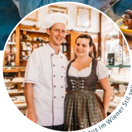
Caféhaus im Wiener Stil seit 1911