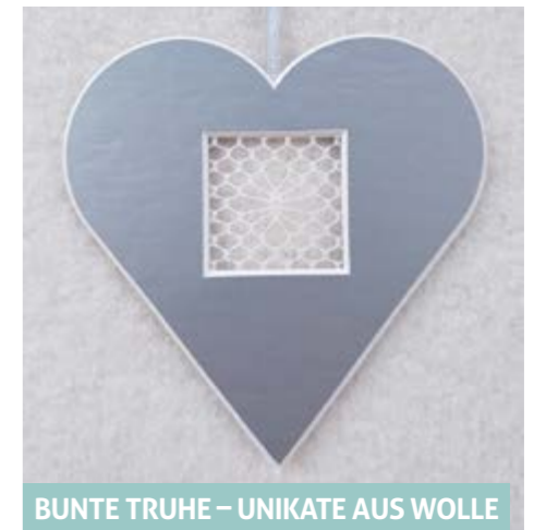
BUNTE TRUHE – UNIKATE AUS WOLLE

Silbertrüffel gefüllt mit schwarzer Johannisbeere und Champagnerganache – Verkaufsgewinne werden jedes Jahr an Einrichtungen in Freiberg übergeben, welche für Kinder etwas Gutes tun.