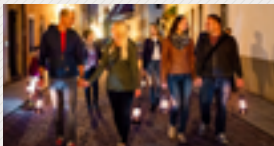
Fackel- und Laternen- wanderungen