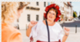
Freiberg für Kinder – Familienführung