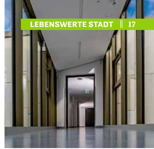
Der futuristische Übergang vom Herderhaus zum Depot.