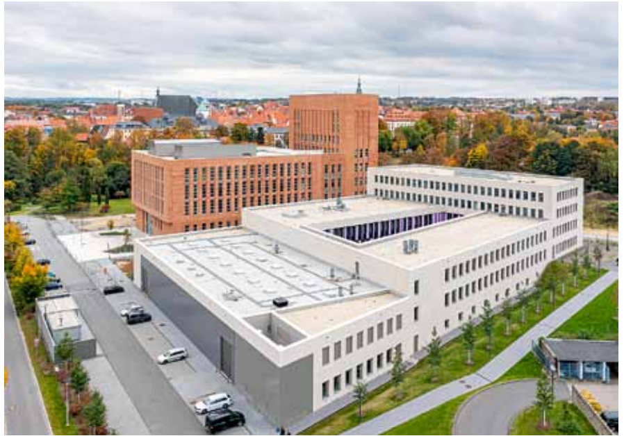
Luftaufnahme der neuen Universitätsbibliothek.