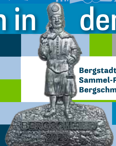
Bergstadtfest Sammel-Pin: Bergschmied