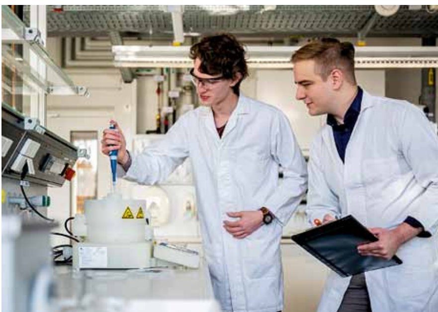
Praxisnah studieren – hier im Studiengang Nanotechnologie.

www.tu-freiberg.de www.studieren-in-freiberg.de