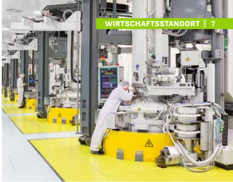
In dieser Halle werden bei der Siltronic AG in Freiberg Einkristalle aus Reinstsilizium gezogen.