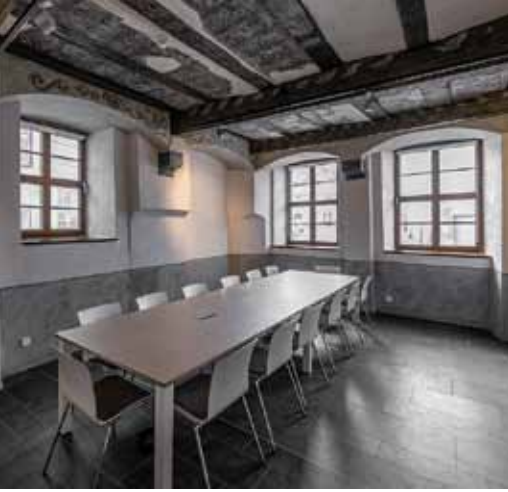
Das Vereinszimmer im alten Steinhaus mit einer Lehmfelderdecke.