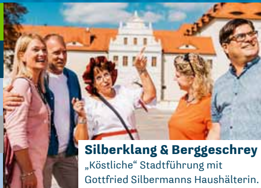
Silberklang & Berggeschrey „Köstliche“ Stadtführung mit Gottfried Silbermanns Haushälterin.