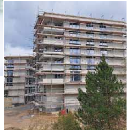
Baufortschritt April 2023, im Vordergrund das Punkthaus.

Alle Gebäude verfügen über einen Aufzug und werden nach Effizienzhaus 55 – Standard errichtet. Sie sind demnach in ihrem Energiebedarf besonders schonend für den Geldbeutel der neuen Wohnungsnutzer und die Umwelt. Eingebettet wird die Wohnanlage in ein parkähnliches Umfeld mit Orangerie,