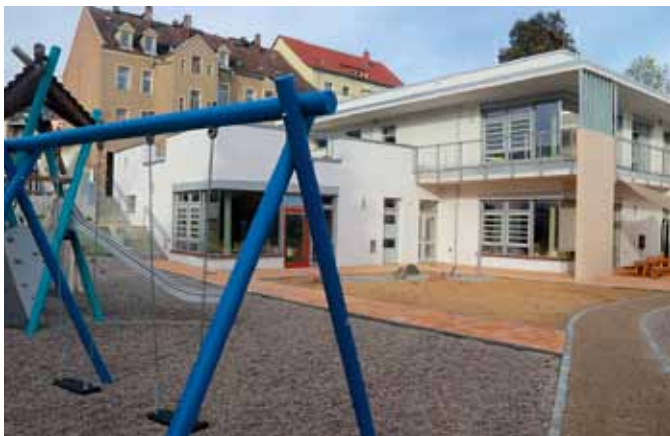
Die „Kita Pustebume“ befindet sich auf der Berthelsdorfer Straße 8. Die Einrichtung wurde 2022 zum vierten Mal als „Haus der kleinen Forscher“ ausgezeichnet.

Eine wohnortnahe Kinderbetreuung und moderne Ausstattung kennzeichnen die Kita-Landschaft Freibergs. Seit im Herbst 2022, die neu gebauten Kindertagesstätten „Kita Pustebume“ und „Villa kunterbunt“ von den Mädchen und Jungen zwischen ein bis sechs Jahren erobert wurden, gibt es nun in allen Kindertagesstätten beste Bedingungen für Eltern, Kinder und Erzieher. Über 11 Millionen Euro wurden an den Standorten in Friedeburg und der Bahnhofsvorstadt zuletzt investiert, um alte Gewerbeimmobilien abzubauen und anstelle dieser die beiden Kindertageseinrichtungen neu zu errichten. Neben der Stadtverwaltung investierten auch Bund, Freistaat und Landkreis in den Umbau.