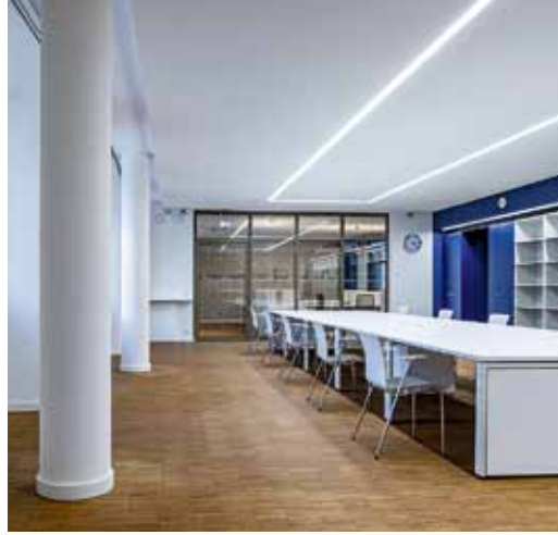
Der großzügig gestaltete Lesesaal im Eingangsbereich lädt zum Verweilen ein.