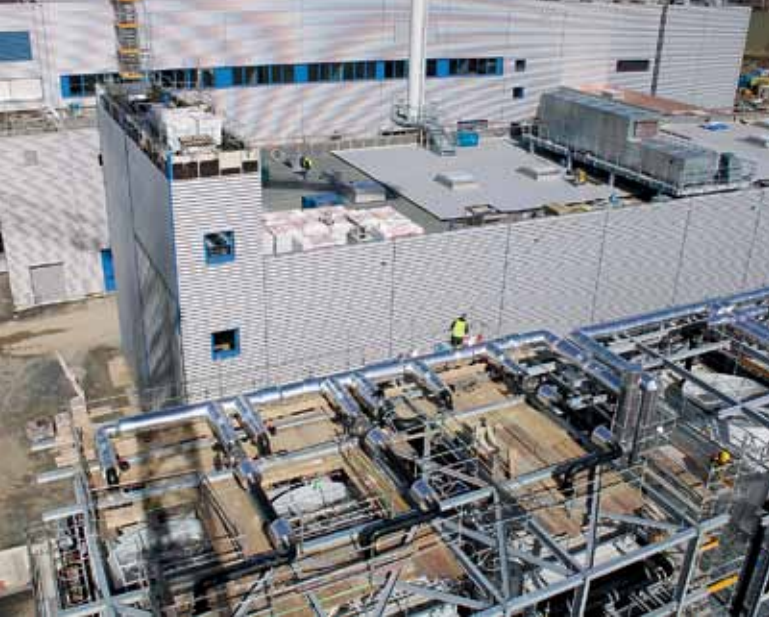
Neben dem Erweiterungsbau der Kristallziehhalle entsteht ein neues Ver- und Entsorgungsgebäude.