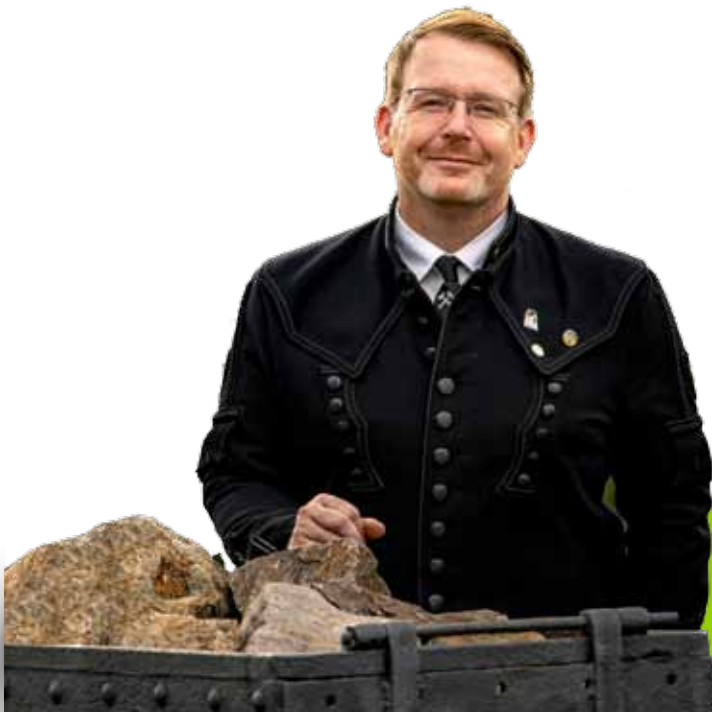
Sven Krüger Oberbürgermeister der Universitäts- und Silberstadt® Freiberg