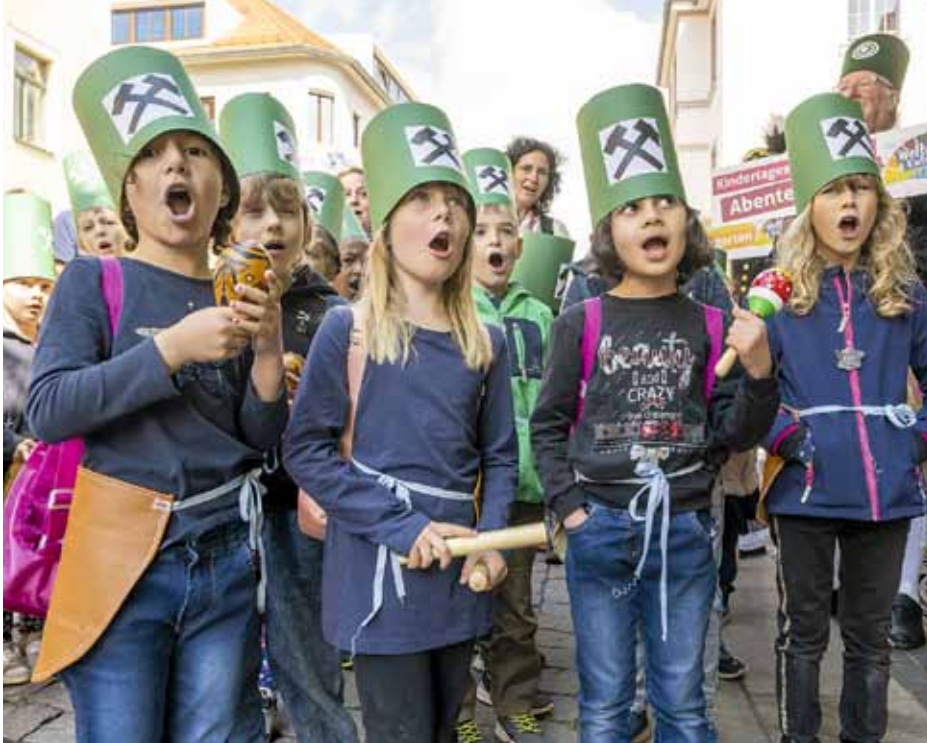
Kleine „Welterbe-Entdecker“ ganz groß: Rund 400 Kinder bei einer kleinen Bergparade stimmen zum Abschluss ihres Vorschulprojektes das Steigerlied an.