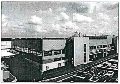
Siltronic ist einer der Weltmarktführer für Wafer aus Reinstsilizium und Partner vieler führender Chiphersteller. Das Unternehmen entwickelt und produziert Wafer mit Durchmessern bis zu 300 mm an Standorten in Europa, Asien und den USA. In Freiberg steht die größte und modernste Anlage von Siltronic, um 300 mm-Wafer zu produzieren.

Im Mittelpunkt der Entwicklung steht heute das Silizium, das für Stadt und Region eine ähnliche Bedeutung erlangte wie Silber in den zurückliegenden Jahrzehnten. Aus dem Betrieb „Spuremetalle“ sind nach 1990 Unternehmen hervorgegangen, die in den Bereichen Silizium, Elektronsilizium und Galliumarsenid auf den Weltmärkten agieren und das Niveau mitbestimmen. Diese Firmen haben am Standort Freiberg erfolgreich investiert - auch dank einer großzügigen Förderpolitik des Landes und der Kompetenz ihrer Mitarbeiter. „Die Stadt Freiberg ist stolz, durch eine kluge Entwicklungspolitik ideale Voraussetzungen für solche Investitionen geschaffen zu haben. Hohe Gewerbesteuererinnahmen versetzen Freiberg in die Lage, zukünftige Projekte und Investitionen sicher zu planen“, versicherte das Stadtobhaupt zur Pressekonferenz. „Viele Persönlichkeiten, Institutionen und Unternehmen haben mit ihrem Engagement wesentlich zum Gelingen des Strukturwandels der Freiburger Industrie beigetragen.“