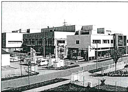
FCM im Gewerbegebiet Süd: Das Unternehmen ist europaweit das einzige, welches Galliumarsenid herstellt und gehört zu den Weltmarktführern.

Freiberg hat allen Grund zum Feiern: Seit 1957 kommen Elektronikwerkstoffe aus Freiberg. Damit kann die Stadt in diesem Jahr auf eine 50-jährige ereignis- und sehr erfolgreiche Geschichte dieses innovativen Wirtschaftszweiges zurück blicken. Das soll feierlich begangen werden, denn inzwischen gehören die hiesigen Unternehmen dieser Branche zu den so genannten „global players“ der Halbleiterindustrie sowie der Solarwirtschaft und Freiberg damit gegenwärtig zu einem der wichtigsten Standorte.