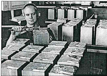
Blick in eine Produktionshalle der Deutschen Solar AG. Das Unternehmen, mit derzeit rund 750 Mitarbeitern, will bis Ende 2009 mindestens 1000 Beschäftigte haben.

Festveranstaltung am 29. März - Erfolgreiche Entwicklung vom Zentrum der Bergbau- und Hüttenindustrie zum Halbleiterstandort