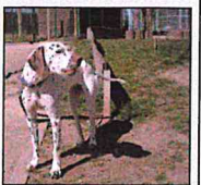
Der etwa ein bis zwei Jahre alte Dalmatiner ist sehr anhänglich und zutraulich.