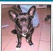
Zutraulich und spielt mit dieser Mischlingshund. Das Tier ist etwa sechs Monate alt.