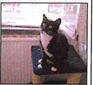
Verschmutzt und stubenrein ist diese etwa sieben Monate alte Katze.

Derzeit leben diese Tiere im Freiburger Tierheim, wo sie auf ein neues Herrchen hoffen. Weitere Infos zu Fundtieren gibt es unter der Freiburger Rufnummer 23 670.