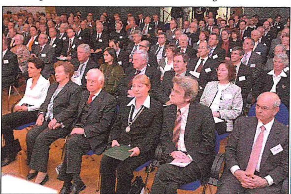
Festveranstaltung anlässlich „50 Jahre Elektronikwerkstoffe aus Freiberg“ in der Alten Mensa. Zahlreiche Gäste hatten und haben große Aktien an der genannten Entwicklung des Halbleiterstandortes Freiberg.

Zur Festveranstaltung am 29. März, die sich der Erfolgsgeschichte Freibergs und der gelungenen Entwicklung vom Zentrum der Bergbau- und Hüttenindustrie zum Halbleiterstandort widmete, konnte der ehemalige sächsische Ministerpräsident, Prof. Kurt Biedenkopf als Festredner gewonnen werden.