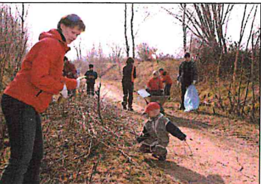
Unterhalb der Reichen Zeche: Auf und an dem ehemaligen Bahndamm gab es viel zu tun - hier fanden sich auch zahlreiche Helfer ein. Bei einem Frühlingsspaziergang kann sich davon überzeugt werden.

„Sauberes Freiberg“. „Da hat es allen Beteiligten richtig Spaß gemacht und es ist viel geschafft worden.“ Geharkt, geräumt und geputzt wurde an vielen Orten in Freiberg: Herders Ruh, Reiche Zeche, am Häusersteig sowie auf Rad- und Wanderwegen wie u. a. der Radweg zwischen Freiberg und Brand-Erbisdorf und der Wanderweg entlang der ehemaligen Bahnstrecke im Bereich der Reichen Zeche. Das waren die offiziellen Treffpunkte, die Neie mit seinen Mitarbeitern für den diesjährigen Frühjahrsputz bestimmt hatte. Die Auswahl scheint die Freiburger mächtig angesprochen zu haben, denn nicht nur, das sehr viele kräftig mit zugapackten, sondern viele kamen gleich mit der ganzen Familie. Vereine, Unternehmen und viele Freiburger, die längst eine Patenschaft im Rahmen der Aktion „Sauberes Freiberg“ für ein „Stückchen Stadt“ übernommen haben, machten auch andernorts die Bergstadt frühlingsfrisch, wie beispielsweise am Wernepplatz im Bereich der Saxonia-Freiberg-Stiftung, am Schlüsselsteig, auf dem Messplatz/Parkplatz, entlang des Friedmar-Brendel-Weges, auf dem Friedberger Bolzplatz, auf der Skaterhalle bei der Reichen Zeche, auf dem Platz hinter dem Herderhaus, auf dem Gelände der Feuerwehren, auf dem Platz der Einheit und dem Parkplatz sowie am Mühlteich. „Es ist enorm, wie viele Freiburger doch bereit sind, unentgeltlich in ihrer Freizeit mit zu packen für ihre Stadt“, zeigt sich