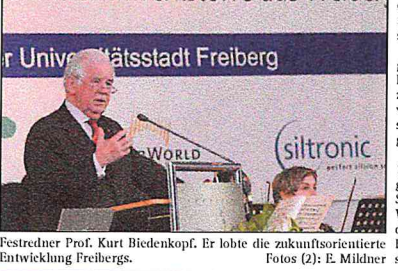
Festredner Prof. Kurt Biedenkopf. Er lobte die zukunftsorientierte Entwicklung Freibergs.