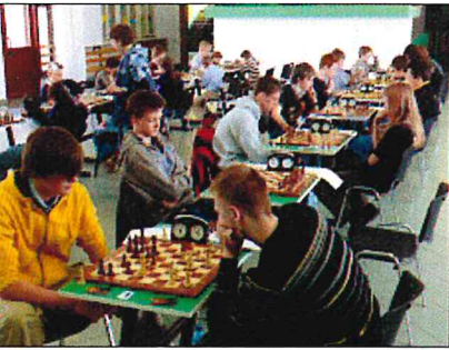
Gemeinsamer Denksport: Freiburger und Walbrzycher Schüler werteten beim ersten gemeinsamen Schachturnier.

engagierten sich Kinder- und Jugendkontakbüro und der Verantwortliche für Städtepartnerschaften der Stadtverwaltung gemeinsam, um diese Fahrt zu ermöglichen. Denn: Ehrenamtliches Engagement zu fördern und stärken, diese Forderung steht schon länger im politischen und gesellschaftlichen Raum. Das Bewusstsein für die Notwendigkeit des Ehrenamtes weiter zu entwickeln und Plattformen dafür zu schaffen bzw. zu vermitteln, ist auch erklärtes Ziel des städtischen KJKB.