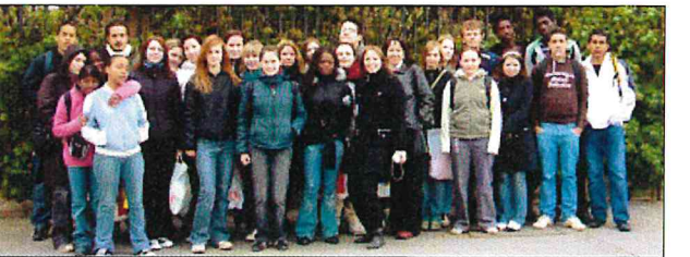
Eine Woche verbrachten sie gemeinsam: die Teilnehmer des jährlichen Schüleraustausches zwischen Freiberg und der französischen Partnerstadt Gentilly.

Freude an ein Widersprechen und auf die deutsche Schachpartie. Schach im kommenden Jahr. Für diese Sache werden wir uns auch weiterhin persönlich wie auch als Schachverein Freiberg TV 1844 mit einbringen.“