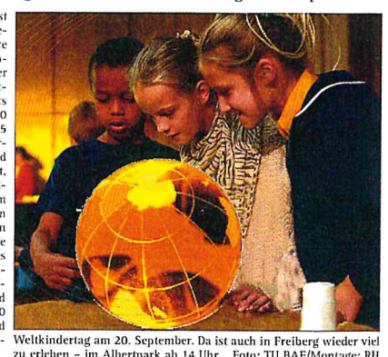
Weltkindertag am 20. September. Da ist auch in Freiburg wieder viel zu erleben - im Albertpark ab 14 Uhr.

Eröffnet wird das bunte Fest durch Freiburgs Oberbürgermeisterin Dr. Uta Resch. Der weltweite Kindertag wurde 1954 auf Empfehlung der 9. Vollversammlung der Vereinten Nationen an ihre Mitgliedsstaaten eingerichtete. Bereits ein Jahr später beteiligten sich 40 Länder, heute sind es mehr als 145 Staaten in denen der Weltkindertag gefeiert wird. In Deutschland anfangs öffentlich kaum beachtet, begann das Deutsche Kinderhilfsprogramm 1989 diesen Tag mit einem Kinder- und Familienfest zu feiern und auch politische Forderungen zur Durchsetzung der Kinderrechte zu erheben. Inzwischen ist dieses Fest in Berlin das größte nichtkommerzielle Kinder- und Familienfest Deutschlands und wird darüber hinaus in mehr als 400 weiteren deutschen Städten und Gemeinden alljährlich am 20. September gefeiert.