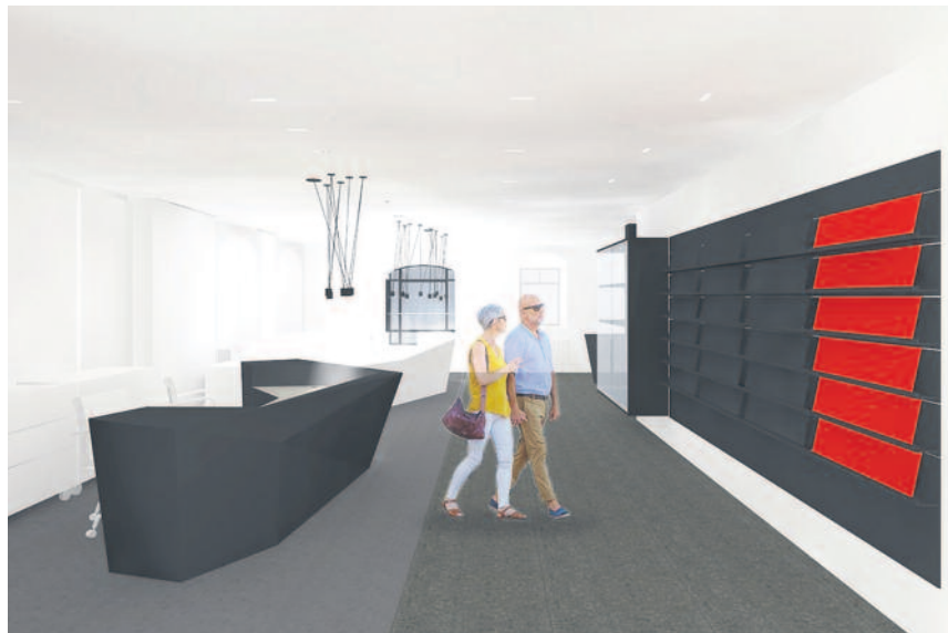
Hell und geräumig empfängt die neue Tourist-Information die Besucher.

Das Amt Kultur-Stadt-Marketing wird nach dem Bergstadtfest in die neuen Räumlichkeiten einziehen. Die Schließdauer für die Tourist-Information am derzeitigen Standort wird, so kurz wie möglich, Mitte August gehalten. Die Stadtverwaltung Freiberg, insbesondere das Amt Kultur-Stadt-Marketing, die Mittelsächsische Theater und Philharmonie gGmbH sowie die Silbermann Gesellschaft freuen sich alle Interessierten zur Eröffnung der neuen Räumlichkeiten am Schlossplatz 6, am Sonnabend, 19. August 2017 begrüßen zu dürfen.