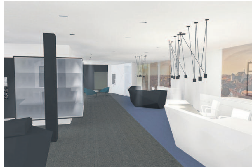
Visualisierung: ATELIER n.4