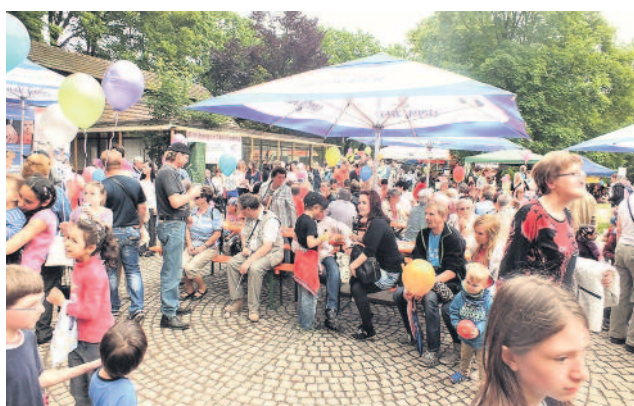
2.500 Gäste kamen zum Familientag.