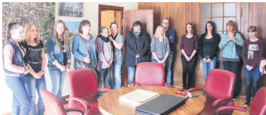
Das Rathaus öffnete für Besucher die Tür ins Büro des Oberbürgermeisters.

Nach der Aktion wurden die „Fundstücke“ der Schüler von Mitarbeiter der Gesellschaft für Strukturentwicklung und Qualifizierung Freiberg mbH (GSQ) weggeräumt. Auch für das nächste Jahr ist die Fähnchenaktion geplant. Dann ziehen die Schülerinnen und Schüler wieder durch den Albertpark und halten Besucher und Hundehalter zu mehr Sauberkeit an.