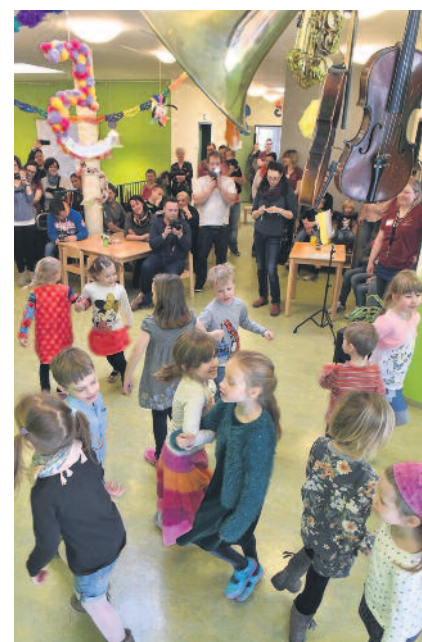
Der „Singkreisel“ sang zum Auftakt „Wir wollen euch begrüßen“.

Vor fünf Jahren, am 1. März 2012, öffnete die Kita Brummkreisel mit sieben Erzieherinnen und Erziehern ihre Tore für 30 Kinder. Heute betreut die Einrichtung mit ihrem 17-köpfigen Team rund 100 Kinder. Ein Schwerpunkt der pädagogischen Arbeit liegt im musischen Bereich. Die Erzieherinnen selbst spielen verschiedene Instrumente: angefangen bei der klassischen Geige über das Akkordeon bis hin zur Trompete und Ukulele. Neben der musikalischen wird auch Wert auf die sprachliche Förderung gelegt. So erhalten bereits die Kinder ab drei Jahren Englischunterricht.