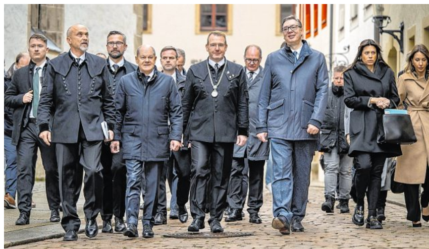
Setzt auf die Rohstoffexpertise aus Freiberg: Serbiens Präsident Aleksandar Vucic (3.v.r) besuchte gemeinsam mit Bundeskanzler Olaf Scholz (2.v.l.) die Universitätsstadt Freiberg.