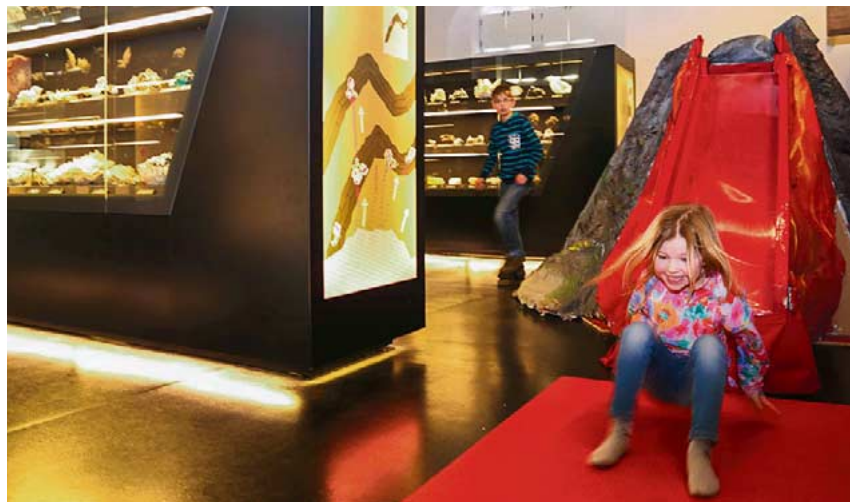
Ferienstapfen in der terra mineralia: Brodelnde Vulkane entdecken und sogar auf ihnen rutschen.