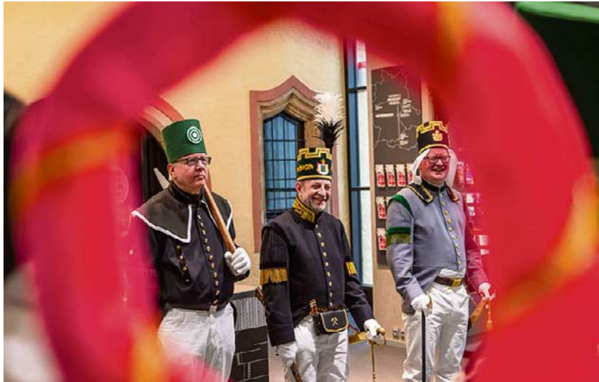
Bergbau hautnah erleben im „neuen“ Museum.

Angestaubtes Image? Von wegen! Das Stadt- und Bergbaumuseum Freiberg ist auf dem Weg in die Moderne. Mit viel Kreativität und multimedial wollen die Mitarbeiter die Stadt- und Bergbaugeschichte neu gestalten. Enthalten sind die Ideen und Vorhaben dafür im neuen Museumskonzept, das die Stadträte in ihrer Sitzung am 16. Januar einstimmig beschlossen haben. Auf historische Entdeckungstour können Besucher inzwischen im Museumsanbau „Silberne Pforte“ gehen. Das Gebäude und der erste Teil der neuen Dauerausstellung „Der silberne Faden“ zum Freiburger Bergbau und Hüttenwesen sind am 24. Januar offiziell eingeweiht worden. → Seite 5