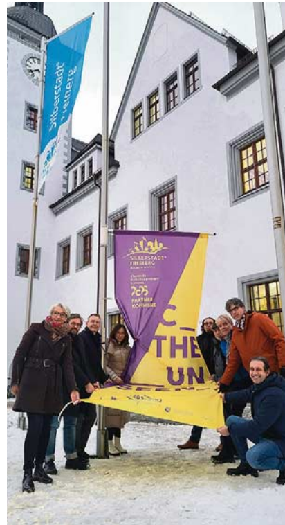
Gut zu sehen: Freiberg ist dabei. Die Silberstadt ist Partner der Kulturhauptstadt Chemnitz 2025.

Die Stadt Freiberg fördert kreative Vorhaben, die die Kulturhauptregion bereichern, mit je 1.500 Euro. Dafür können Anträge noch bis 1. September 2025 gestellt werden.