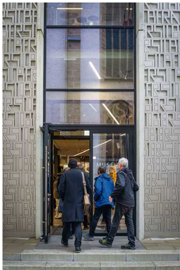
Die „Silberne Pforte“ führt hinein ins „neue“ Stadt- und Bergbaumuseum, übrigens bis Juni kostenlos.

Das Museum als Ort von Sammlung, Gedächtnis- und Erinnerungsspeicher, Lernort, auch Kommunikations- und Veranstaltungsort, das alles soll das Stadt- und Bergbaumuseum auch weiterhin sein – künftig aber moderner. Mit seiner Ausstellung soll es Besuchern Orientierung geben und obendrein gut unterhalten. Kreative Ideen, interessante Installationen und mo-