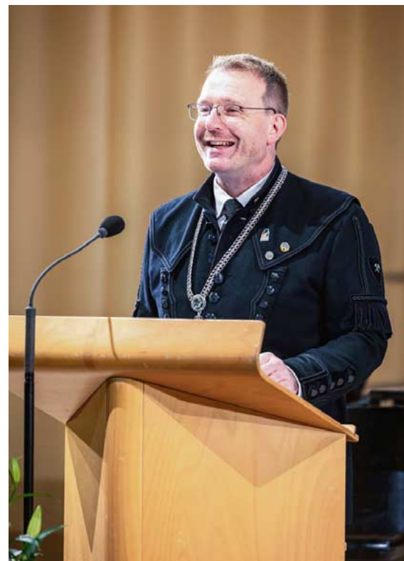
Klare, aber auch optimistische Worte fand Oberbürgermeister Sven Krüger fürs neue Jahr für die Stadt Freiberg.

Mit dem Blick nach Israel oder in die Ukraine gerichtet, wünsche ich mir für 2025 ganz persönlich, dass die Türen zum Frieden aufgestoßen werden.