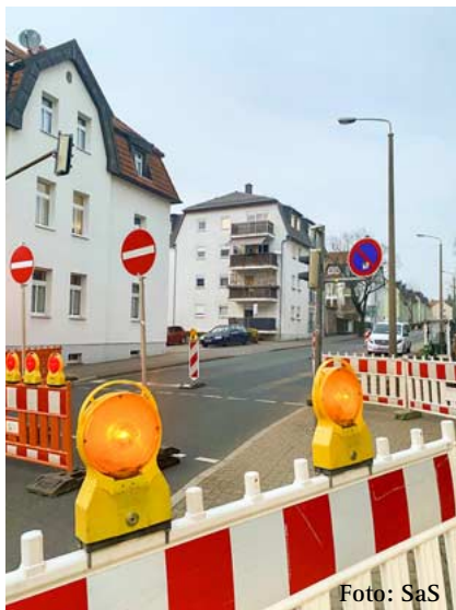
Gesperrt, damit der neue Fußweg gebaut werden kann: die Peter-Schmohl-Straße.

Der Bauabschnitt liegt zwischen der Oststraße und der Frauensteiner Straße. Von der B173 kommend kann die Peter-Schmohl-Straße per Einbahnstraße befahren werden,