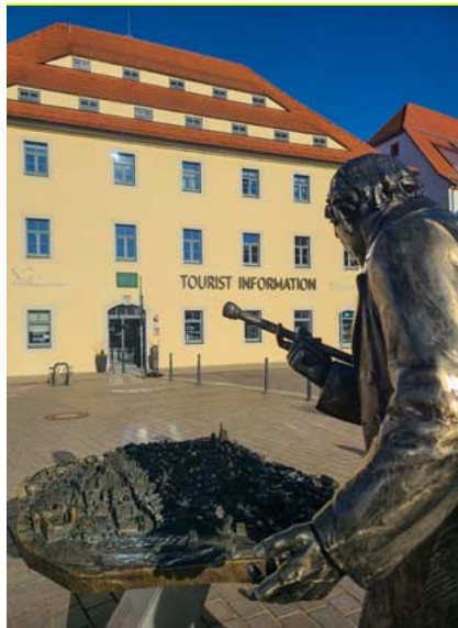
Erster Anlauf vieler Gäste: die Tourist-Information am Schloßplatz.