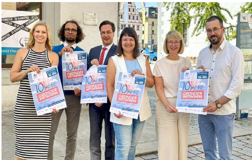
Rufen gemeinsam mit der Stadt zum zehnten Gründerwettbewerb auf – Vertreter der Sparkasse Mittelsachsen (3.v.l.), der IHK (2.v.r.) und von Saxeed (r.).

Freiberg belohnt innovative Geschäftsideen – und das bereits seit 2016. Zum zehnten Jubiläum des Gründerwettbewerbs „Lebendige Innenstadt“ erweitert die Stadt ihren Wettbewerb und setzt neue Akzente. Der Preis wird dieses Jahr erstmals in drei unterschiedlichen Kategorien vergeben und gemeinsam mit dem Gründungsnetzwerk SAXEED an der TU Bergakademie Freiberg ausgerichtet. Damit soll die Verbindung von Stadt, Gesellschaft und Universität gestärkt werden. Prämiiert wird in drei Bereichen: Neben neu gegründeten Geschäften werden auch bestehende Läden mit einer beispielgebenden Entwicklung ausgezeichnet sowie kreative Ideen für innovative Produkte oder neugedachte Dienstleistungen. → Seite 4