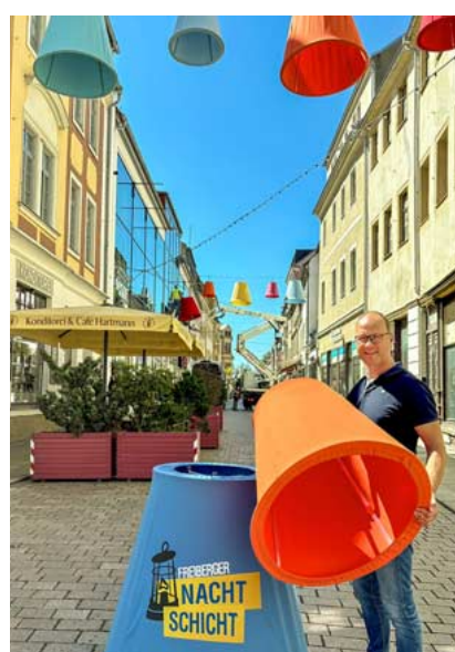
Straßendeko gewechselt: Riesige Lampenschirme in Korngasse und Petersstraße leuchten zur Nachtschicht.

Programm → Seite 7. Teilnehmende Händler und Kneipen: www.freiberger-nachtschicht.de