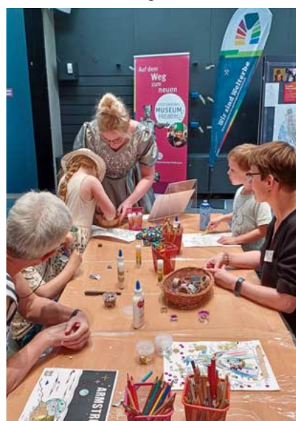
Selbst Hand anlegen konnten die Kinder in der Malereiwerkstatt.

Genau 1.709 (Stand: 2024) Kinder und Jugendliche haben einen Bibliotheksausweis. Das sind rund 40 Prozent der insgesamt 4.000 Leser. Da viele jüngere Kinder über die Ausweise ihrer Eltern angemeldet sind, dürfte die tatsächliche Anzahl der jungen Nutzer noch höher, schätzungsweise bei 50 Prozent,