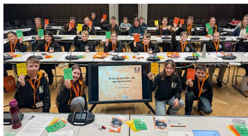
Mit Freude dabei: Im KiPa arbeiten 24 Schüler aus Grund- und Oberschulen sowie dem Gymnasium mit.