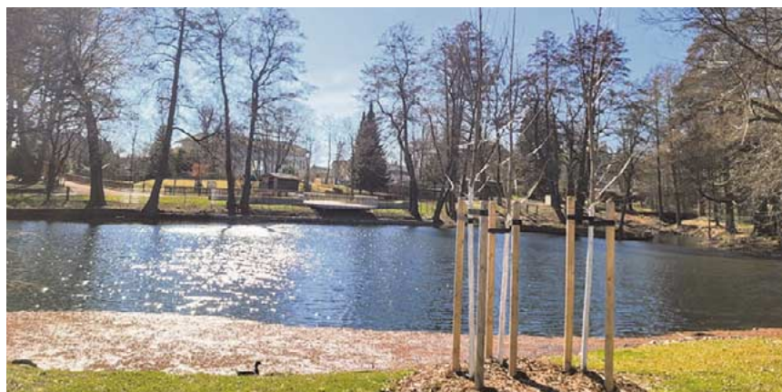
Pferdeschwemme im Tierpark: Eine Mauer soll künftig den Uferbereich klar abgrenzen und besser schützen.

Der Stadtrat tagt wieder am 2. April. Die Sitzung beginnt 16 Uhr im Ratssaal. Auf der Tagesordnung stehen u.a. der Bericht des Oberbürgermeisters und die Fragestunde der Einwohner. Die Sitzung ist öffentlich.