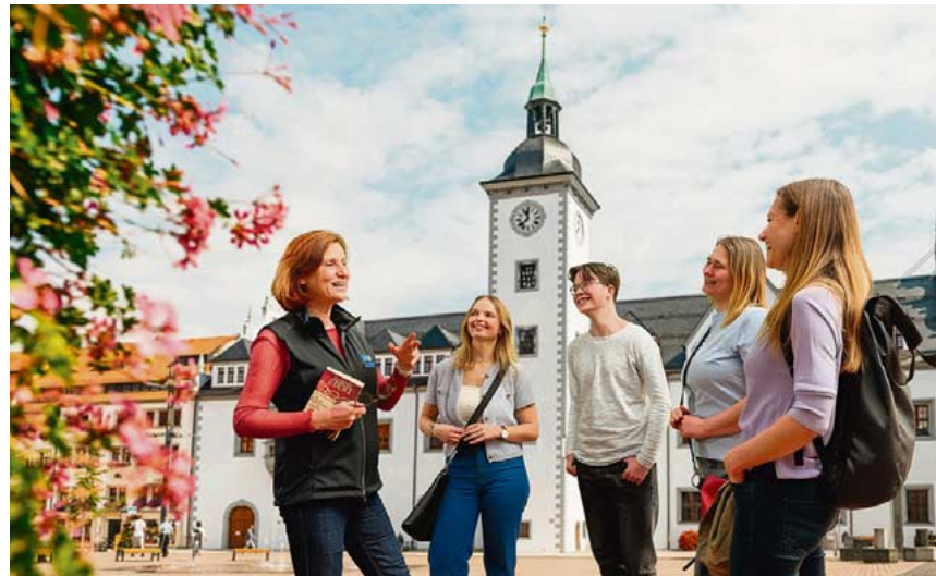
„Auf den Spuren der Hebamme Marthe“ – Die neue literarische Stadtführung zum 20. Jubiläum der Hebammen-Saga von Sabine Ebert startet am 12. April – Die ersten andert-halbstündigen Touren sind bereits ausverkauft.

„Das Großartige an Sabine Eberts Büchern ist, dass sie akribisch recherchiert sind und deutsche Geschichte wirklich lebendig werden lassen, dabei Freibergs Wachsen in die Epoche einbetten“, beschreibt Katharina We-