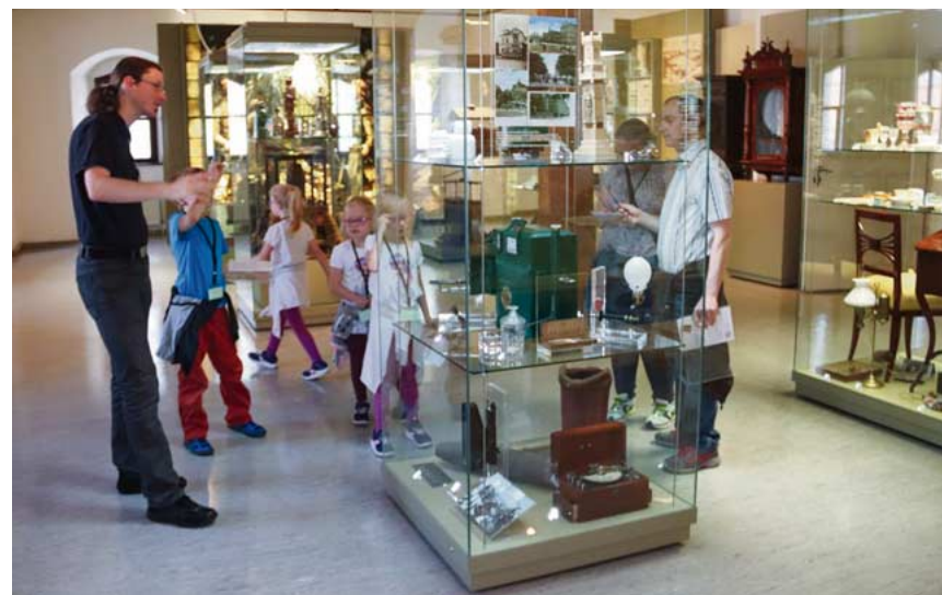
Das Stadt- und Bergbaumuseum lädt zur Körbchen-KnobelEi im Ergänzungsbau ein. Ab 27. März sind dort neue Ausstellungsbereiche zu entdecken!