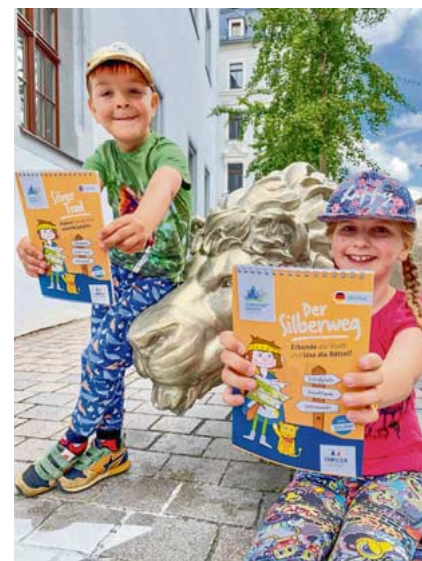
Erlebniswege wie den Silberweg können Ferienkinder mit Rätselblock und App entdecken

28. und 29. März, jeweils von 10 bis 17 Uhr, Ostermarkt Schloss Freudenstein mit handgemachtem Schmuck, liebevolle Holzarbeiten, schönen Dekorationen sowie Angeboten für Kinder und Familien, Eintritt frei!