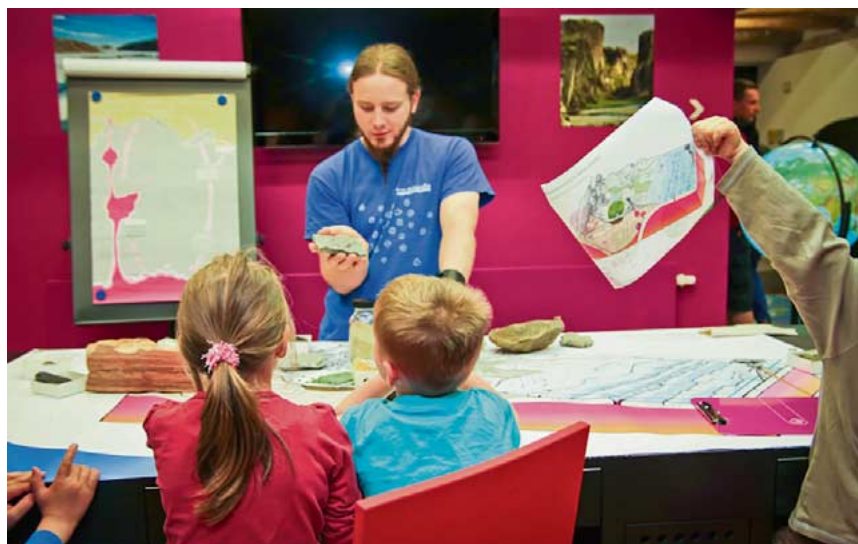
Beim Ferienprogramm „Mensch und Mineral“ oder im Mitmach-Labor entdecken Teilnehmer alles rund um Minerale in der terra mineralia.