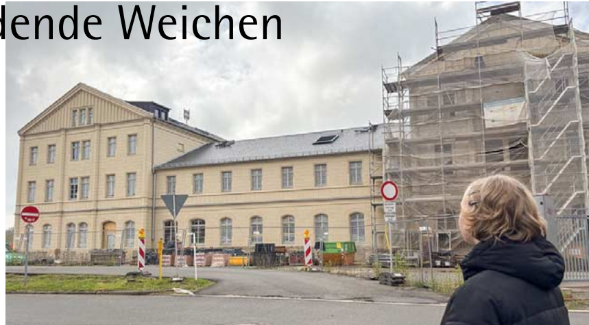
Der Stadtrat hat richtungsweisende Schritte für den Bahnhof beschlossen.

Die Stadt Freiberg schafft neue Gewerbe- und Industrieflächen. Der Stadtrat hat den Bebauungsplan für das Gewerbe- und Industriegebiet „Schwarze Kiefern“ im Teilbereich DBI an der Halsbrücker Straße einstimmig beschlossen. Damit werden die rechtlichen Voraussetzungen geschaffen, um auf rund 18,5 Hektar ein neues Gewerbe- und Industriegebiet zu entwickeln. Der Bebauungsplan legt genau fest, was auf den Flächen gebaut und genutzt werden darf. Außerdem regelt der Plan, wo Grünflächen angelegt, welche Maßnahmen zum Schutz von Natur und Umwelt umgesetzt werden. Die meisten Grundstücke im Plangebiet gehören der Deutschen Brennstoffinstitut Vermögensverwaltungsgesellschaft mbH, ein Teil ist Privatbesitz. Der Bebauungsplan muss vor Inkrafttreten beim Landkreis Mittelsachsen genehmigt werden. Danach wird er öffentlich bekannt gemacht.