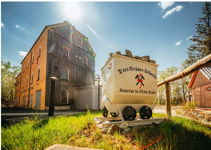
Der Drei Brüder Schacht in Zug: Höhepunkt der geführten Wanderung durch das Zuger Bergbaugesbiet am 2. Mai.

Am Sonnabend, 2. Mai, geht es bei einer geführten Wanderung durch das Zuger Bergbaugesbiet – ein Teil der Montanlandschaft